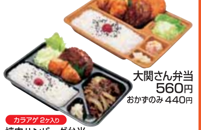
大関さん弁当 560円 おかずのみ 440円