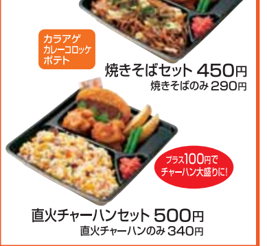
カラアゲ カレーコロッケ ポテト 焼きそばセット 450円 焼きそばのみ 290円