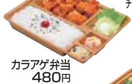
カラアゲ弁当 480円 おかずのみ 360円