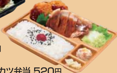
テキ・カツ弁当 520円 おかずのみ 400円