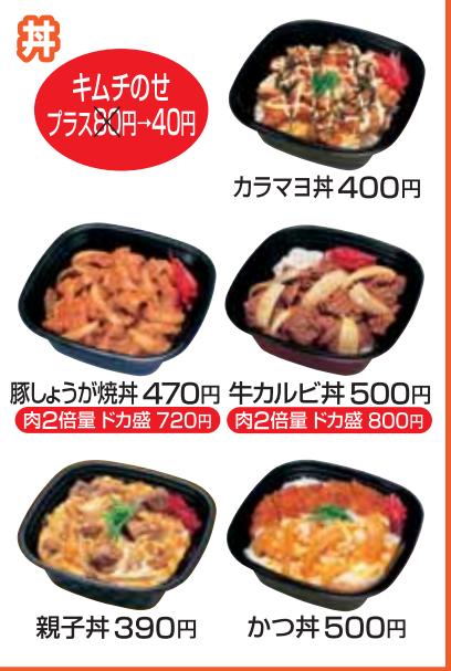
キムチのせ プラス80円→40円 カラマヨ丼 400円