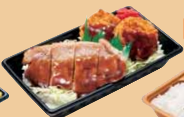
豚テキ ヒレカツ テキ・カツ丼 500円