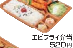
エビフライ弁当 520円 おかずのみ 400円