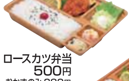
ローズカツ弁当 500円 おかずのみ 380円