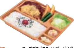
チーズデミグラスハンバーグ弁当 450円 おかずのみ 330円