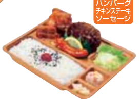
ハンバーグ チキンステーキ ソーセージ ミックスグリル弁当 490円 おかずのみ 370円