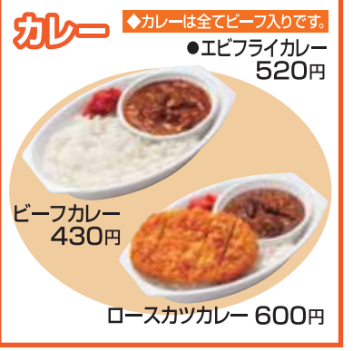
カレー ◆カレーは全てビーフ入りです。 ●エビフライカレー 520円