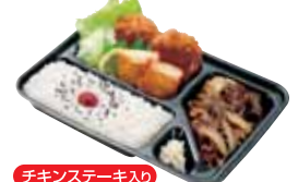
チキンステーキ入り 焼肉ヒレカツ弁当 690円 おかずのみ 570円