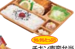
チキン南蛮弁当 480円 おかずのみ 360円