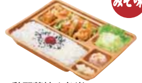
鶏野菜炒め弁当 420円 おかずのみ 300円