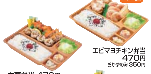
エビ チキン電田 エビヨチキン弁当 470円 おかずのみ 350円