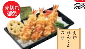
売切れ 御免 のり えび りんごん 海老天御膳 500円