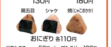
揚げギョウザ(4ヶ) 130円 シュウマイ(6ヶ) 180円 鶏五目 シャケ 焼(じゃこおか) おにぎり 各110円

半熟たまご 50円 カップみそ汁 100円〜 キムチ 80円 お茶 120円〜 ポテトサラダ 100円 カップめん 130円〜 フレッシュサラダ 100円 ミニチキン南蛮(3ヶ) 180円 ごはん 150円