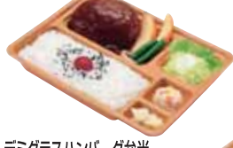
デミグラスハンバーグ弁当 430円 おかずのみ 310円