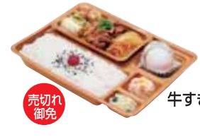
売切れ 御免 牛すき焼弁当 570円 おかずのみ 450円