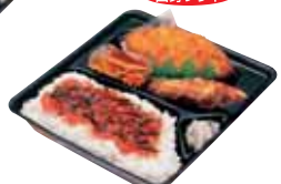
和風もあります 洋風めんたいこ弁当 430円