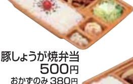
豚しょうが焼弁当 500円 おかずのみ 380円 肉2倍量トカ盛+プラス250円