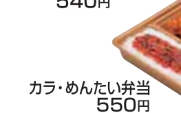
のり・カラ弁当 540円 カラ・めんたい弁当 550円