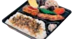
白身フライ 和風もあります 和風じゃこのり弁当 390円