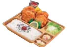
ヒレカツ弁当 500円 おかずのみ 380円