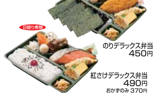
のりデラックス弁当 450円