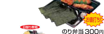
白身フライ お値打ち のり弁当 300円