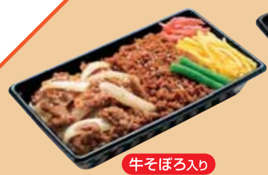
牛そぼろ入り 牛めし弁当 500円